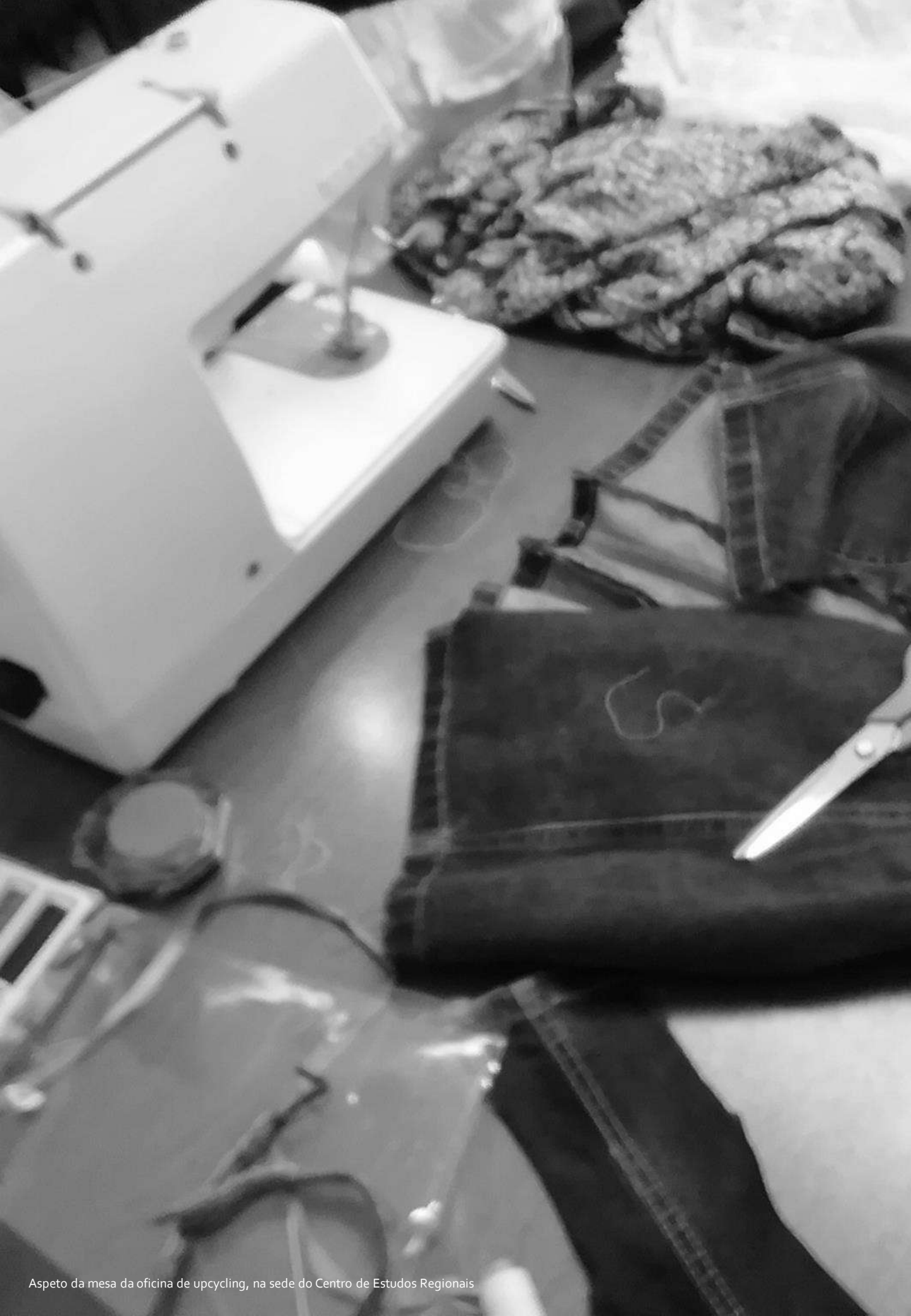
Aspetto da mesa da oficina de upcycling, na sede do Centro de Estudos Regionais