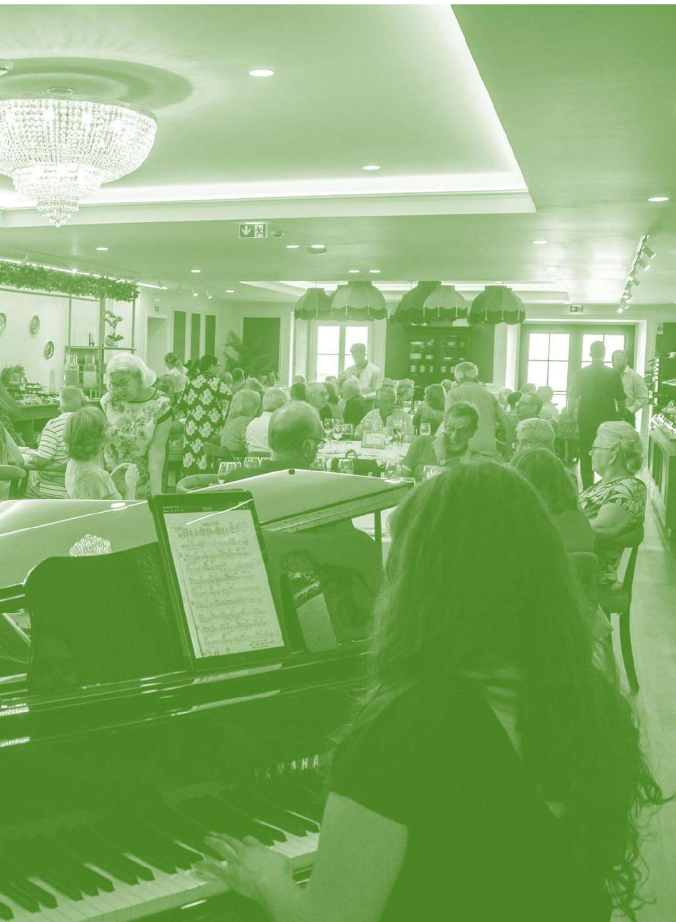
Almoço comemorativo do 45º aniversário do Centro de Estudos Regionais e de encerramento das atividades da Academia Sénior/CER, em junho de 2023